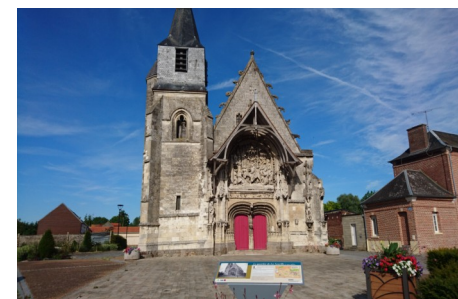
L'église Notre Dame de la Neuville.